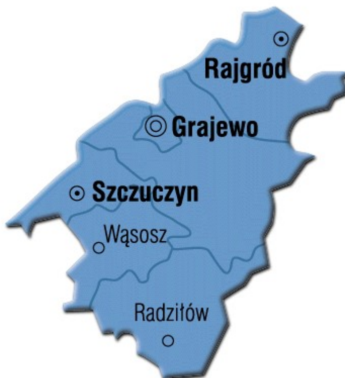
Mapa 1: Położenie gminy Grajewo w powiecie grajewskim

Gmina Grajewo wchodzi w skład powiatu grajewskiego, zajmując w obecnym kształcie obszar 30 820 ha. Położona jest w północno – zachodniej części województwa podlaskiego, granicząc z województwem warmińsko – mazurskim.